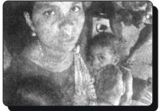
పిల్లలపాలతో బిక్కు బిక్కుమంటూ వున్న ఓ గిరిజన మహిళ