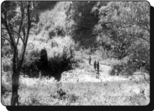
గిరిజన ఓటర్లు అడవిలో కాలినడకన వెళ్తున్న దృశ్యం