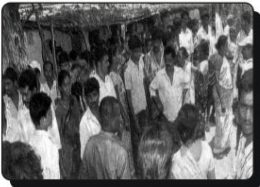
పోలింగ్ను బహిష్కరించి ఆందోళన చేస్తున్న గ్రామస్థులు